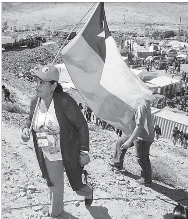
En una procesión al cerro donde flamean 33 banderas, las familias recordaron que se cumplió un mes del derrumbe.