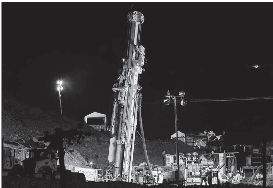
A las 16 horas de ayer comenzó a operar la máquina T-130, que buscará lograr el rescate en un plazo de dos meses.

Entre tanto, el Plan A, a cargo de la perforadora Strata, recuperó terreno al avanzar de 42 a 67 metros, según indicó el ingenie-