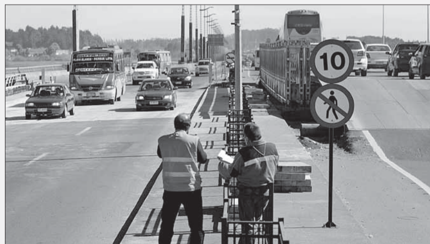
Aprovechando el fin de semana, ayer se inició el retiro de dos estructuras mecánicas que permitían acceder al Puente Llacolén desde Concepción, el único en uso para unir esta ciudad con San Pedro de la Paz, tras el terremoto. Luego de sacar el mecánico de una vía, anoche se retiraba otro de dos pistas, con gran atochamiento.