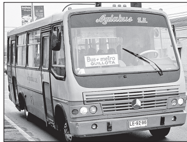
De blanco con celeste a amarillo con verde. Limequi ya no presta el servicio del Bus+Metro. Ahora la encargada es Agdabus.

En la ciudad cementera Limequi iniciaba su recorrido en el centro de la ciudad, pasando calle Maratón, Chañaral y Avenida O'Higgins para continuar por calle Carrera hasta la comuna vecina de La Cruz. Ahora el recorrido se realizará del centro de la ciudad sólo por calle Carrera.