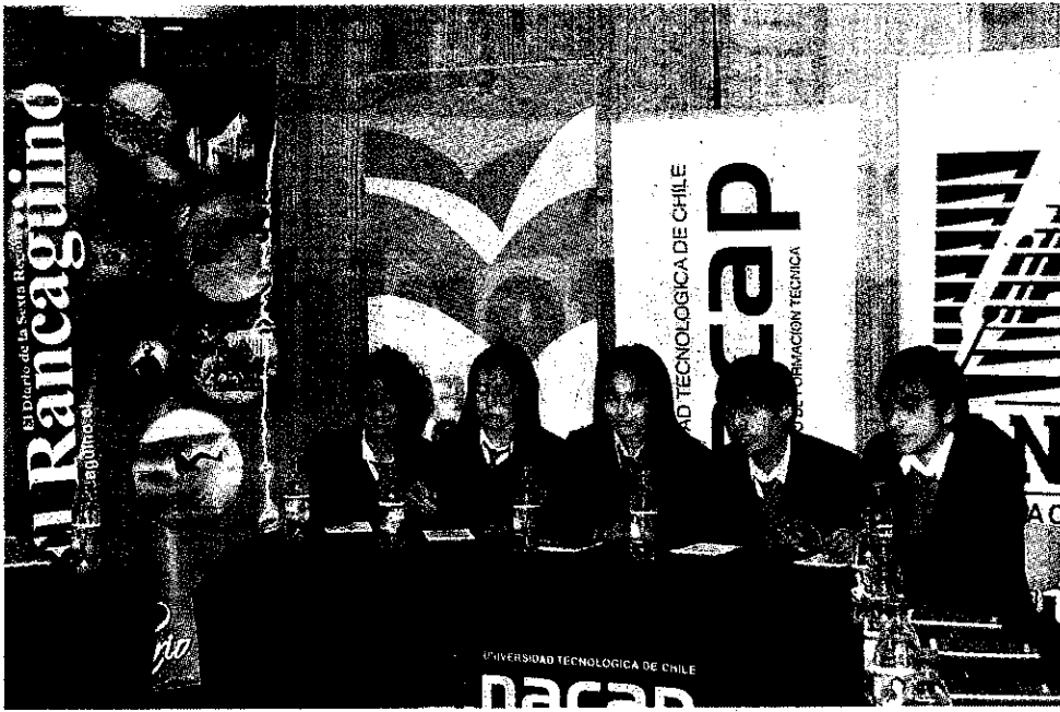
Colegio San Ignacio.