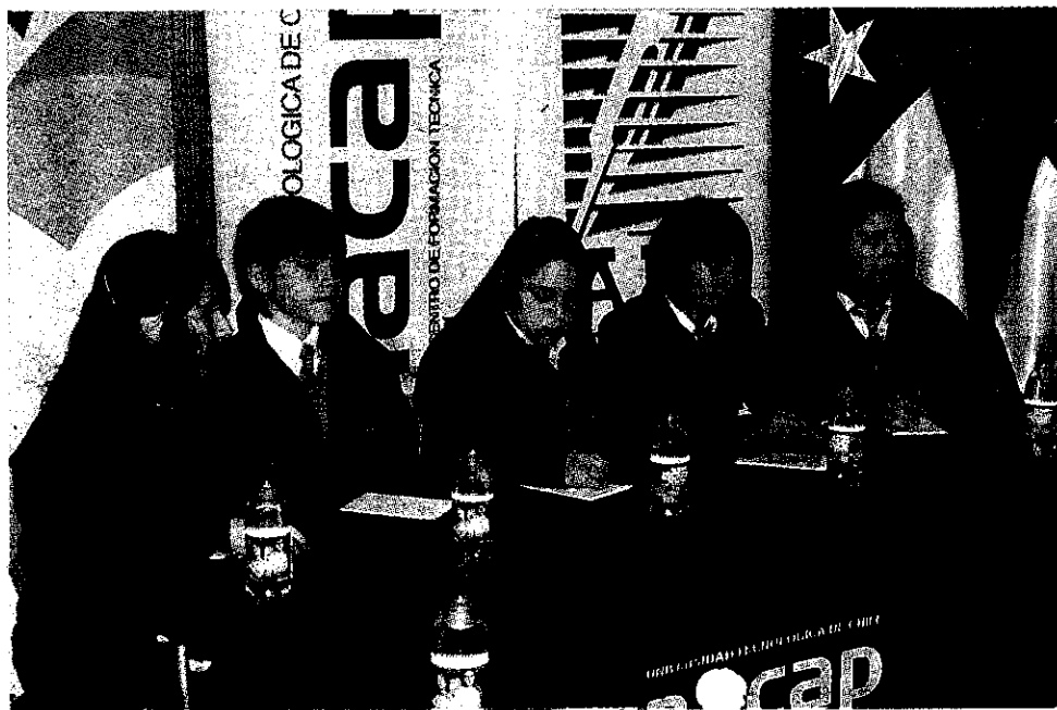
Centro Educativo Asunción.