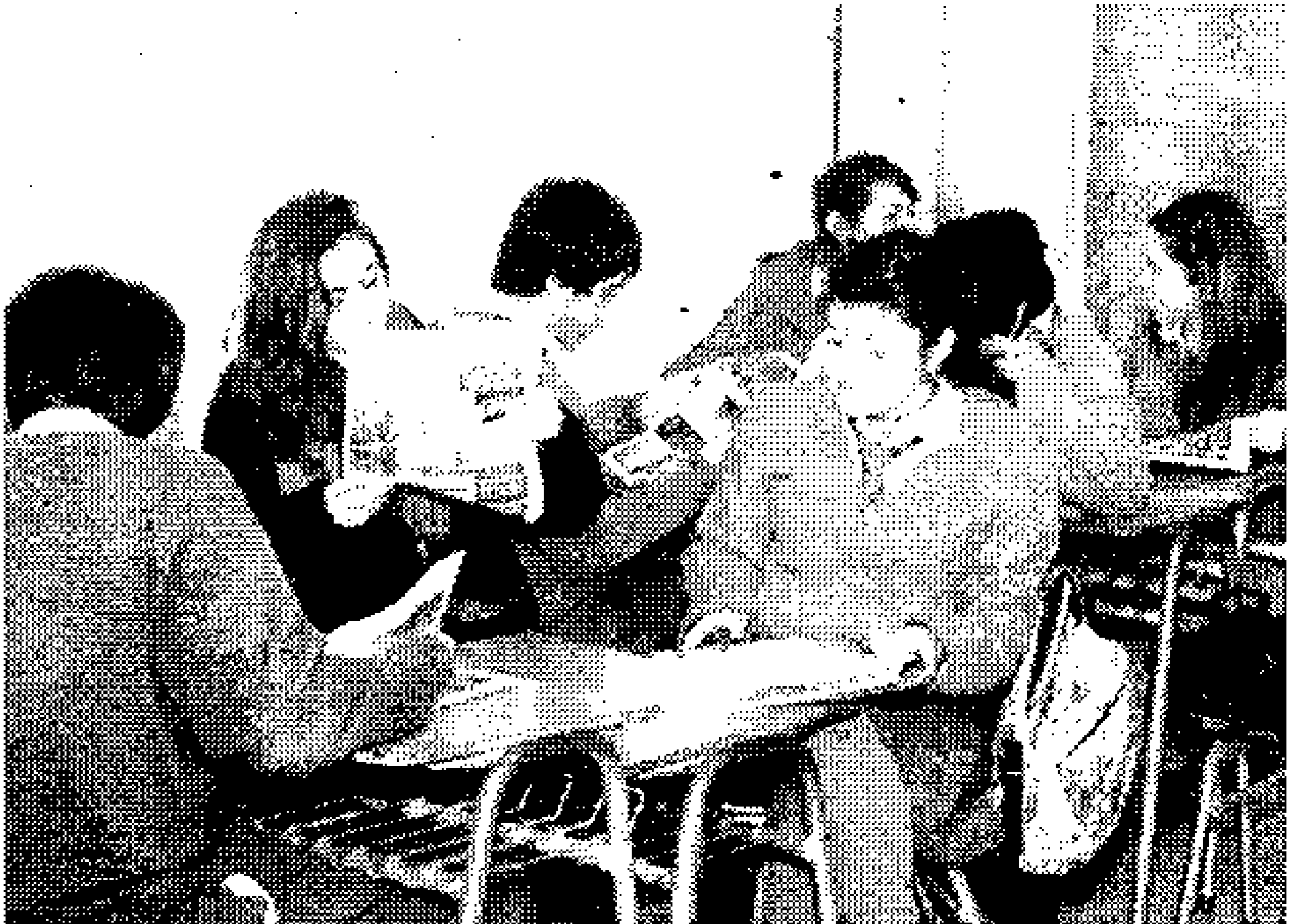
En grupo leen, pero también comentan las pautas noti