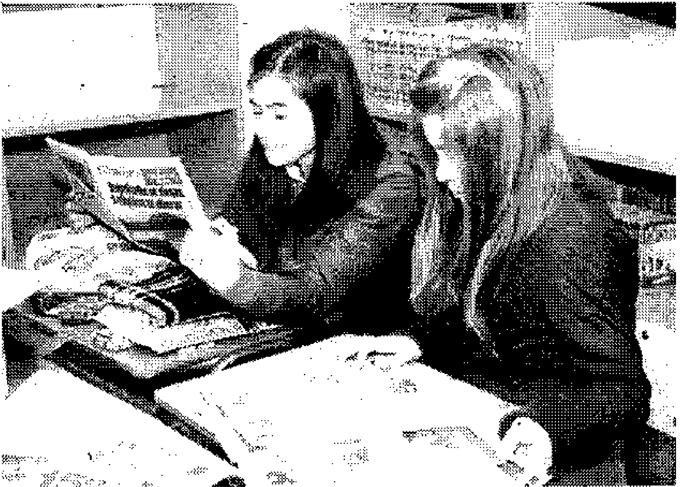
Las noticias del virus AH1N1 son de interés de una parte de los estu