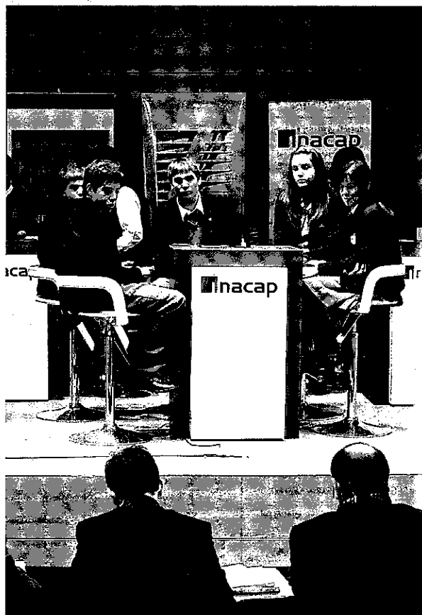
Más de 1.000 estudiantes comenzaron la competencia hace un par de meses. Ahora, sólo quedan 28 en la etapa final.

Mientras, Díaz cuenta que se ha pensado replicar la iniciativa, por ejemplo, en la semana del colegio: "Sería novedoso e incentivaríamos el interés por la contingencia tanto nacional como internacional".