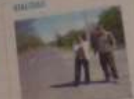
Autoridades visitaron importante pavimentación.

Manifiesta su férrea oposición a cada en la desembocadura de la laguna de Lico. Integristas del ello provoca un daño irreparable a la ecología de la zona.